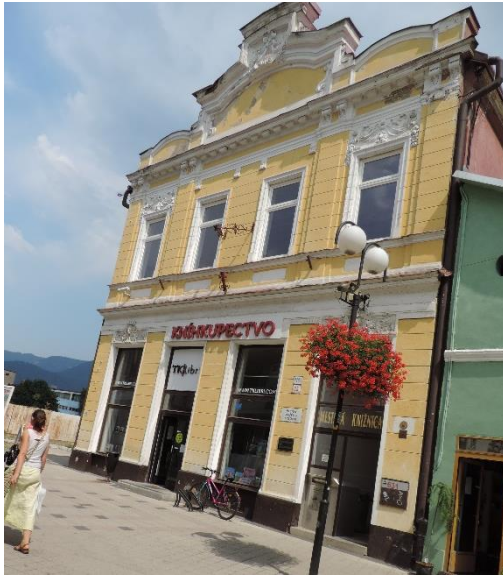
Exteriér a interiér Mestskej knihnice v Ružomberku