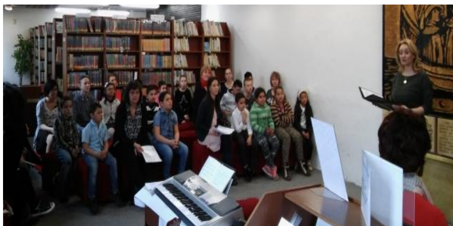
Rané vtáčatá - regionálna súťaž v recitácii poézie a prózy detí špeciálnych základných škôl, ktorú pravidelne organizuje Mestská knižnica v Ružomberku.