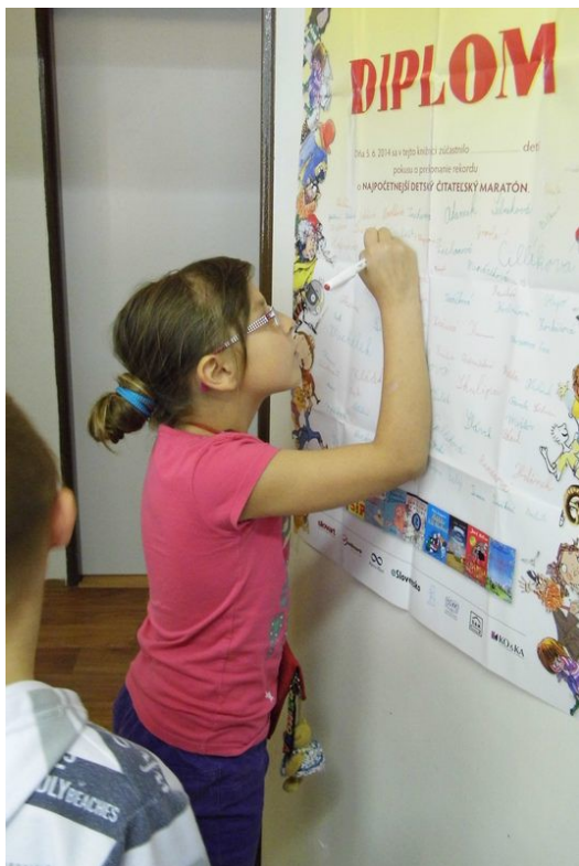
Podujatie „Čítajme“ si v MsK Bytča