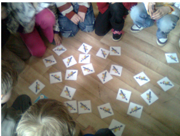
Deti sa hrajú s „knižničným pexesom“ v knižnici v Kotešovej