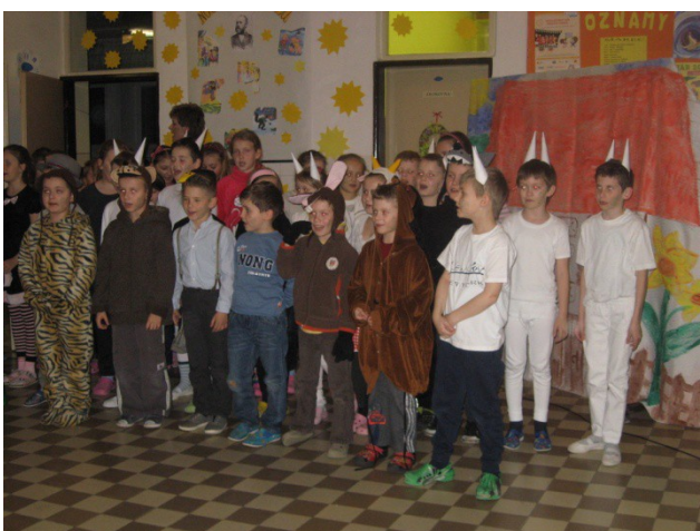
Podujatie Noc s rozprávkou v knižnici vo Veľkom Rovnom