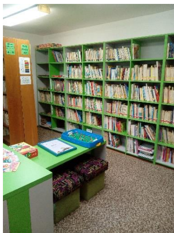
Podujatie a interiér Obcej knižnici v Strečne