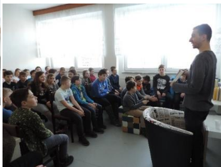
Deti zo Základnej školy v Rosine po prvýkrát v novootvorenej Obecnej knižnici.