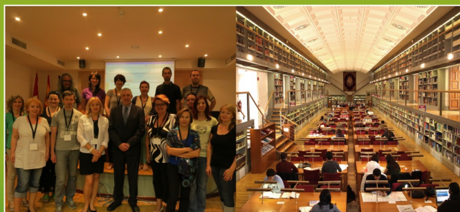
Stretnutie partnerov v Toledě (19. – 21. júna 2013)