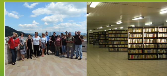
Stretnutie partnerov v Žiline (11. – 13. júna 2014)