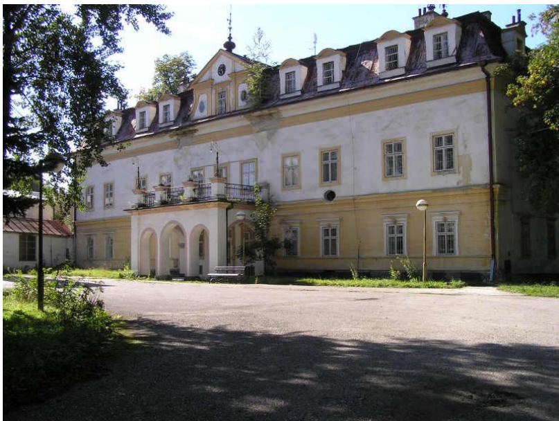
Druhá detská nemocnica na Slovensku, založená v roku 1922 v Žiline Bytčici