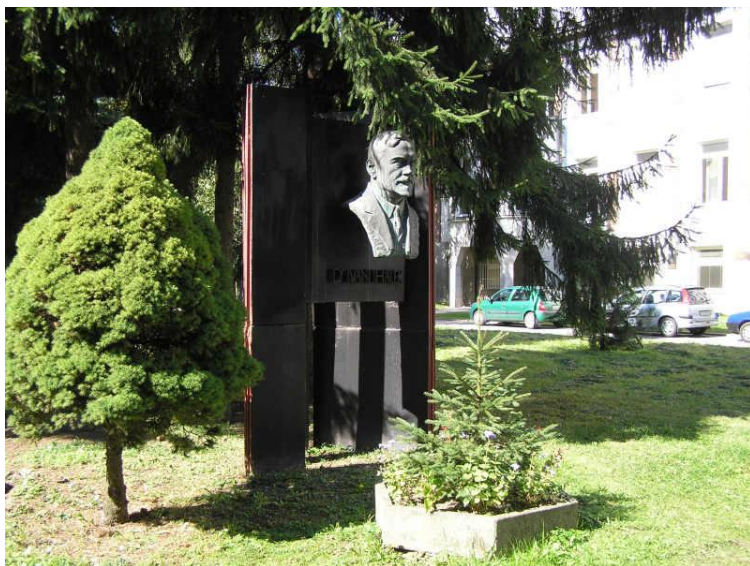
Busta a památník v areáli Nemocnice s poliklinikou v Žiline